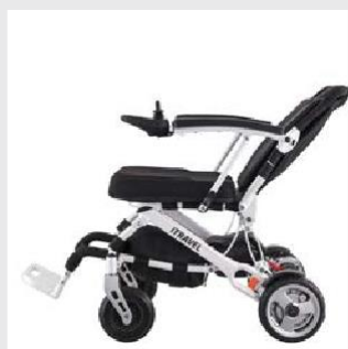
Nastavitelná opierka chrbta