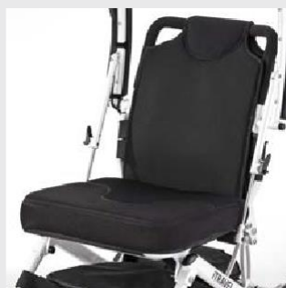
Komfortný sedací systém